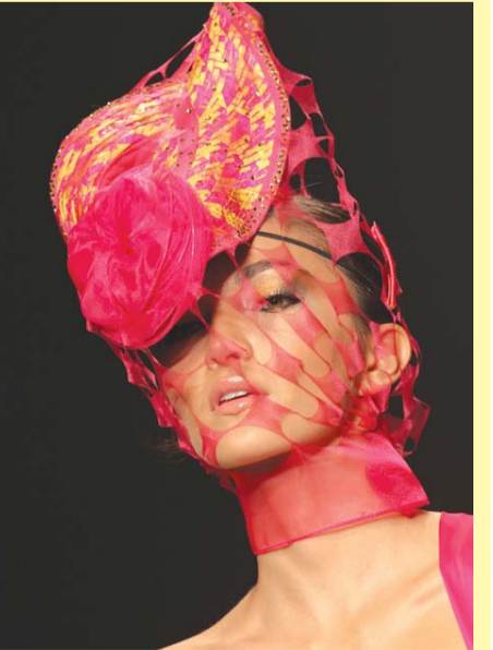
عارضة تقدم زيا للمصمم الكولومبي زاجار .. وأخرى تعرض زيا من تصميم مواطنه بيدراهيتا .. وثالثة تقدم زيا من تصميم سلفيا فراسي .. وأخرى تقدم زيا من تصميم ليغايس خلال عرض أزياء كولومبيا في مدينة ماديلين.